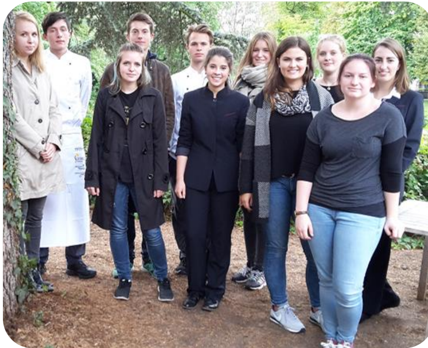
Der Jahrgang 2015-2017

Auf den folgenden Seiten wollen wir Ihnen die Ausbildung im Tigerpalast Variété Theater, im Gesellschaftshaus Palmengarten und im Caféhaus Siesmayer kurz erläutern.