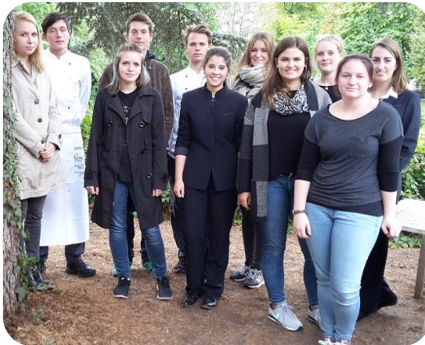
Der Jahrgang 2015-2017

Auf den folgenden Seiten wollen wir Ihnen die Ausbildung im Tigerpalast Varieté Theater, im Gesellschaftshaus Palmengarten und im Caféhaus Siesmayer kurz erläutern.