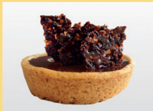
Choc-Kalamansi Tartlet vegan & gluten free