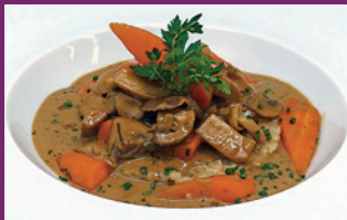
Edelpilze von der Offenbacher Pilzmanufaktur Kroll

Kürbis-Süßkartoffelpüree 160 gr ..... € 4,50