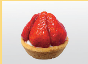
Strawberry Tartlet vegan & gluten free