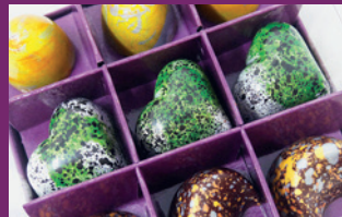
Pralinen Trio aus der Lafleur Pâtisserie