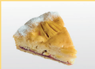
Apple Pie vegan

Ein bisschen Glück für Herz und Ihr Wohlergehen bekommen Sie wie gewohnt im Caféhaus Siesmayer. Ganz neue im Sortiment unsere Vegan Pastry!