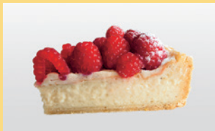
New York Cheesecake with Raspberry vegan & gluten free