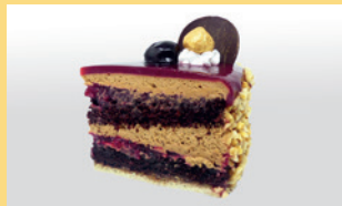
Black Forest vegan