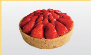
Starwberry Tart vegan & gluten free